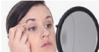
Depilar sin dolor

ETIQUETAS CONSEJOS SALUD.- Que es Hongos Axilas, Causas de Hongos Axilas, Sintomas de Hongos Axilas, Diagnostico de Hongos Axilas, Terapia para tratar Hongos Axilas, Prevencion de Hongos Axilas, Profilaxis de Hongos Axilas.