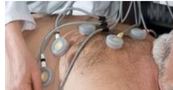
que son Arritmias