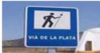
Ruta de La Plata