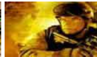
Juegos online Gratis