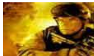
Juegos online Gratis