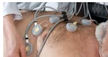
que son Arritmias