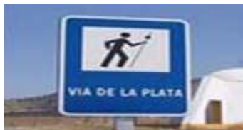
Ruta de La Plata