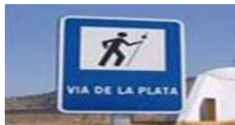
Ruta de La Plata