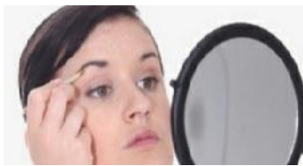
Depilar sin dolor

ETIQUETAS CONSEJOS SALUD.- Que es Laringitis, Causas de Laringitis, Sintomas de Laringitis, Diagnostico de Laringitis, Terapia para tratar Laringitis, Prevencion de Laringitis, Profilaxis de Laringitis,