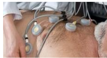
que son Arritmias