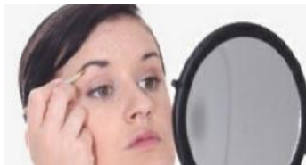
Depilar sin dolor

Gases Intestinales, Terapia para tratar Gases Intestinales, Prevencion de Gases Intestinales, Profilaxis de Gases Intestinales.