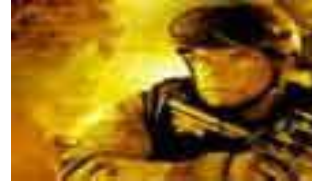
Juegos online Gratis