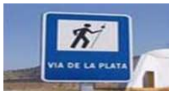
Ruta de La Plata